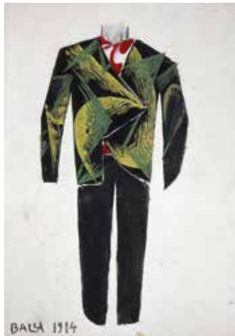
7 Giacomo Balla Entwurf für einen futuristischen Anzug (Abend) Design for Futurist suit (evening), 1914 Sammlung Collection Laura Biagiotti, Guidonia/Rom © VG Bild-Kunst, Bonn 2018